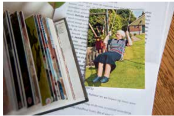
Een van de bewoners tijdens het jaarlijkse uitje

"Het is een mooie traditie geworden. Het begon met fietstochten die we met een aantal burens deden. Veel burens vonden het leuk om een dagtocht met elkaar te maken, maar niet iedereen kon fietsen. Vandaar dat we naar andere mogelijkheden zijn gaan kijken. Maar dan kom je wel op een ander kostenplaatje uit. We begonnen met de trekkerstram uit Gorssel, er konden 28 personen mee. Maar de